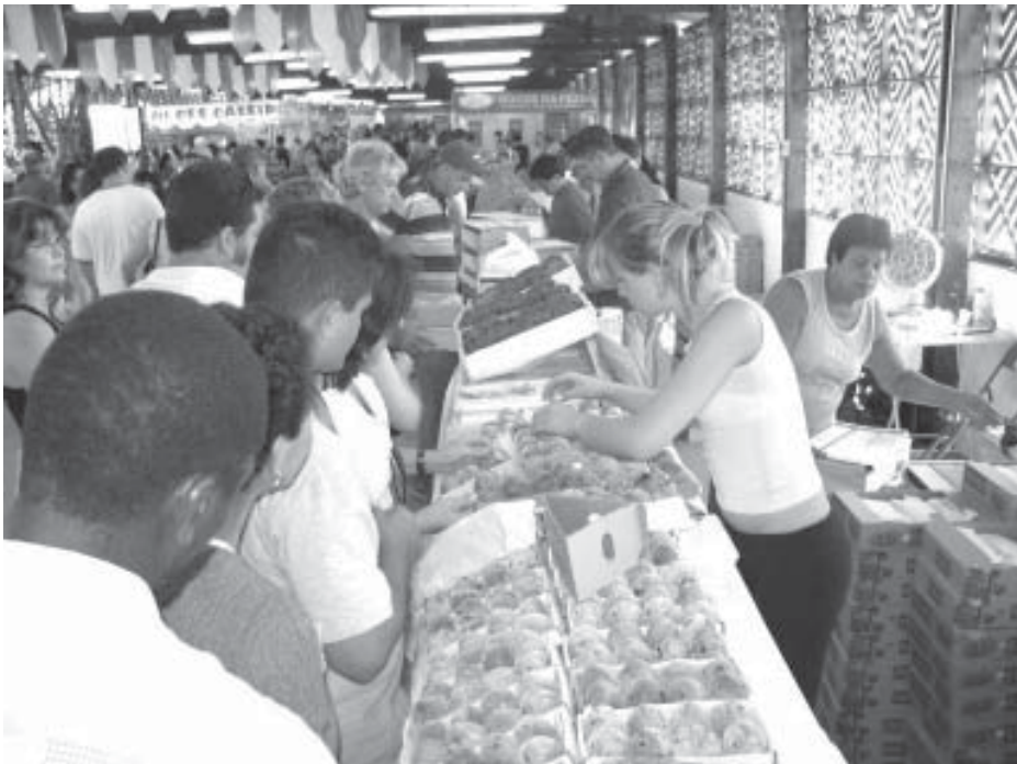
Visitantes podem comprar variedade de frutas diretamente dos produtores rurais