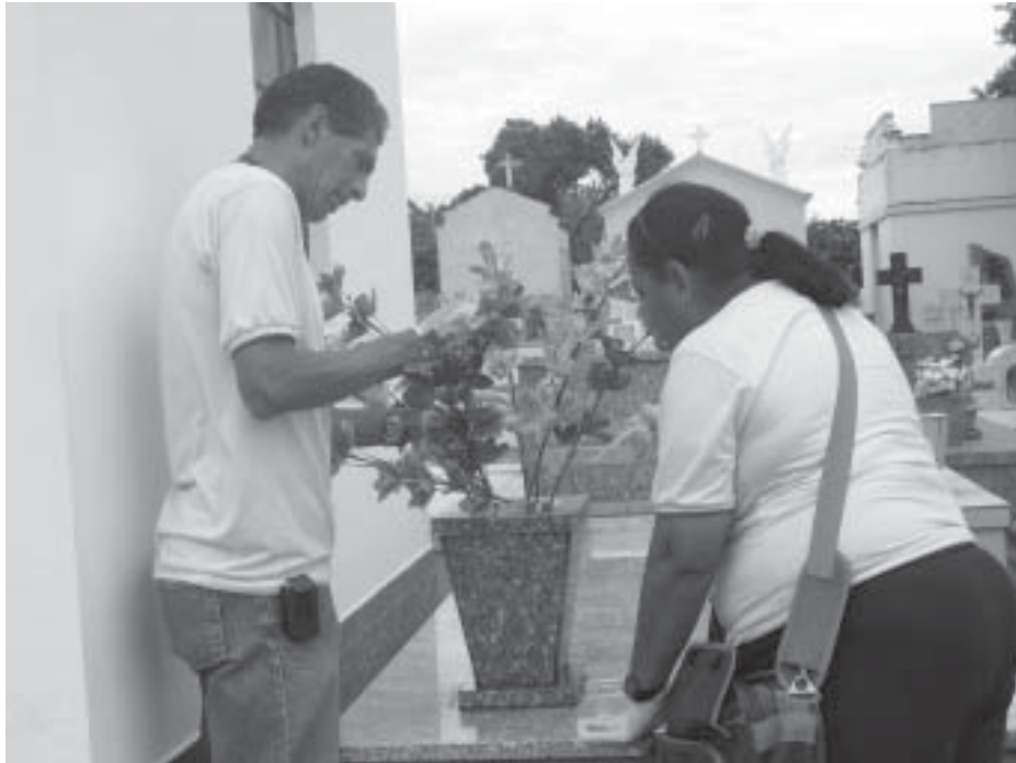
Agentes de Saúde fazem controle de larvas em sepultura do Cemitério

A Secretaria de Saúde, através do Departamento de Saúde Coletiva, está intensificando as ações de prevenção à dengue em todos os pontos da cidade. A preocupação maior nessa época é decorrente do período de chuvas e do aumento da temperatura, que favorecem a proliferação do mosquito Aedes aegypti , transmissor da doença.