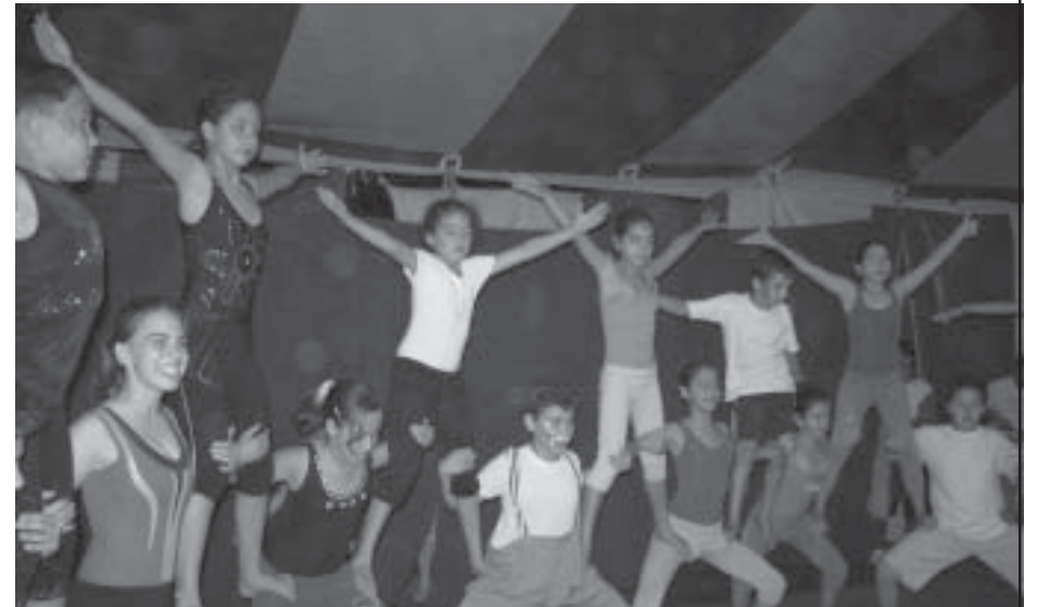
Participantes do "Lona Viva" mostram o que aprenderam

O objetivo do "Lona Viva" não é formar artistas de circo, mas sim despertar nessas crianças o gosto pelas artes e oferecer uma opção saudável de lazer. Essa é uma das opções de descentralização da cultura, que é uma meta da administração municipal.