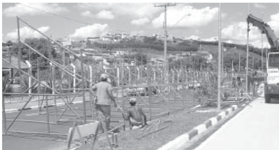
Instalação de arquibancada e iluminação na Av. Altino Gouveia

As coleta de lixo orgânico e de material reciclável também serão realizadas normalmente, segundo a Secretaria de Serviços Urbanos.