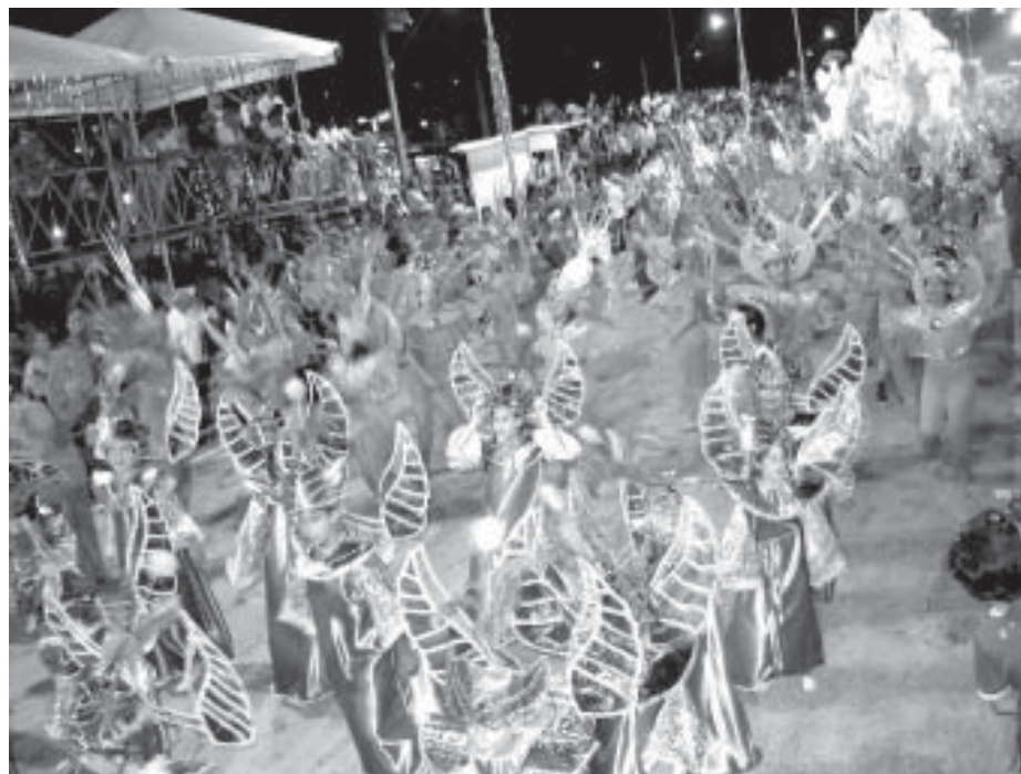
Público acompanha apresentação de escola no carnaval 2006