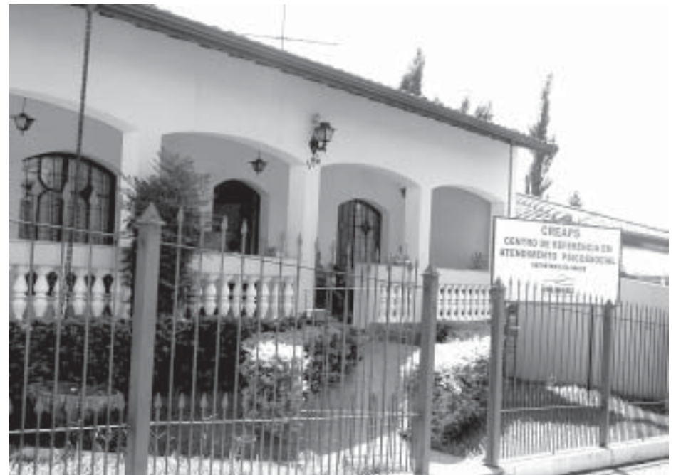
Sede do CREAPS (Centro de Referência em Atendimento Psicossocial)

Atualmente, com exceção de casos de urgência que são atendidos de imediato, o início do tratamento leva de dois a três meses. Como forma de minimizar a demora foram criados grupos de orientação aos pacientes, para que eles tenham condições de lidar com questões mais prementes, como estresse e ansiedade, até iniciarem o tratamento. Em muitos casos, eles conseguem resolver seus problemas nesses grupos. Os trabalhos são coordenados por psicólogos e duram em média cinco sessões. Casos de urgência, como surtos, devem ser dirigidos ao pronto-socorro, pois o CREAPS oferece apenas atendimento ambulatorial. Os telefones do CREAPS são 3829-2524 e 3829-2073