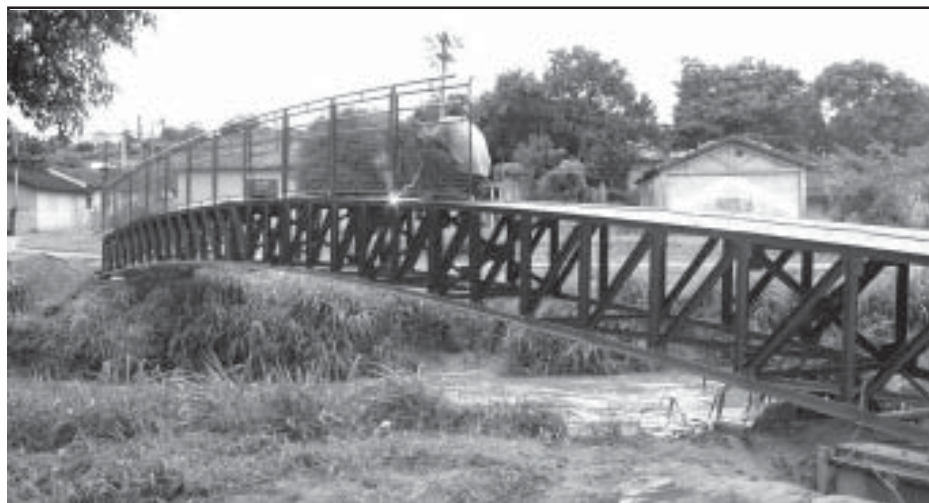
Técnicos instalando gradil na passarela do bairro Capuava

de um equipamento de lavagem em alta pressão e água quente. Também foi realizada a dedetização e desratização do ginásio através de uma empresa contratada. Após esta etapa, a Secretaria fará a pintura do local e colocará redes nas laterais para impedir a entrada de pombos.