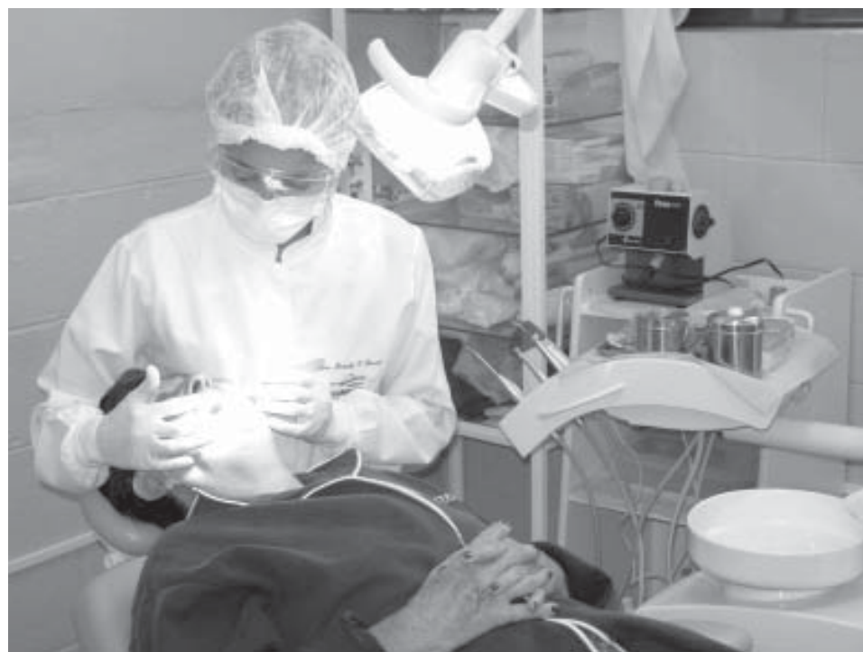
Dentistas farão avaliação bucal para prevenção do câncer

espaços do poder. O evento, aberto ao público, será realizado às 19 horas, na sala Prof. Ivan Fleury Meirelles, no Paço Municipal. A realização da conferência é da Secretaria de Desenvolvimento Social e Habitação e do Conselho Municipal dos Direitos da Mulher.