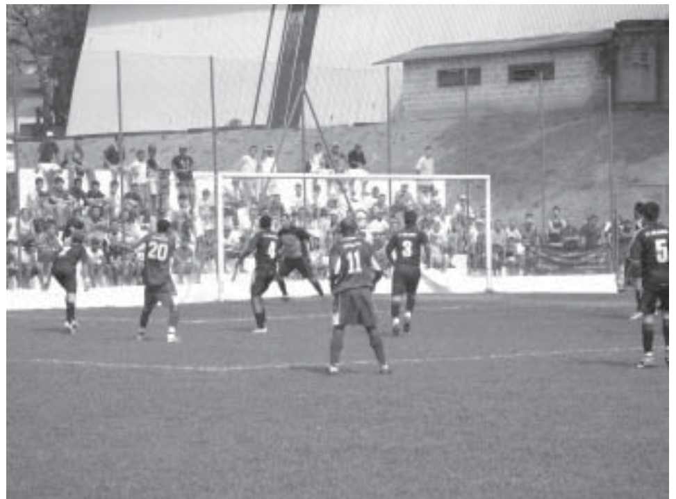
A partida inaugural será realizada no Estádio Eugênio Franceschini

prestar contas aos vereadores sobre as ações promovidas neste primeiro trimestre de 2007. A iniciativa inédita será realizada trimestralmente.