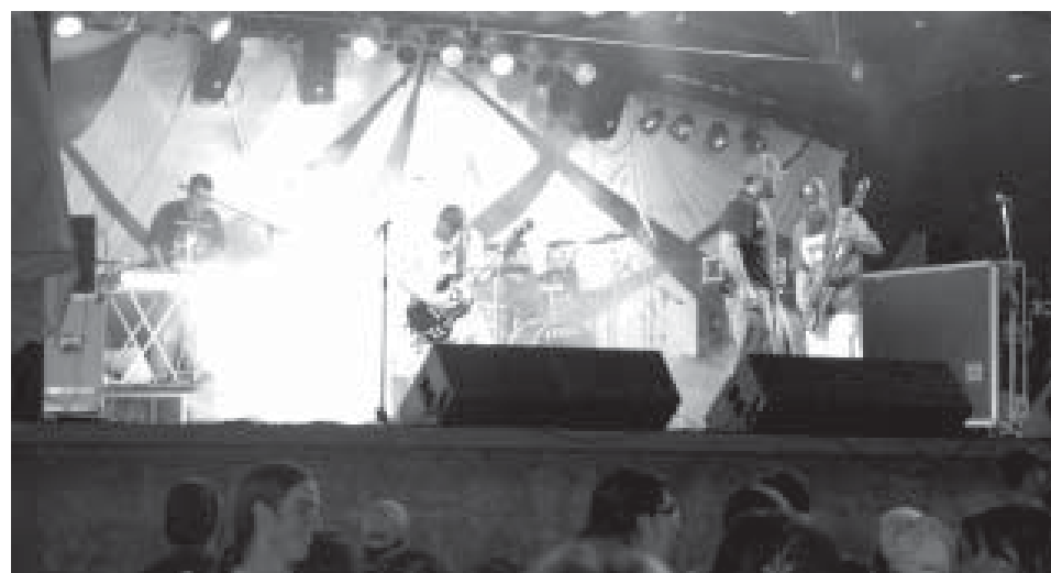
A banda Tharroll promete muita animação no sábado