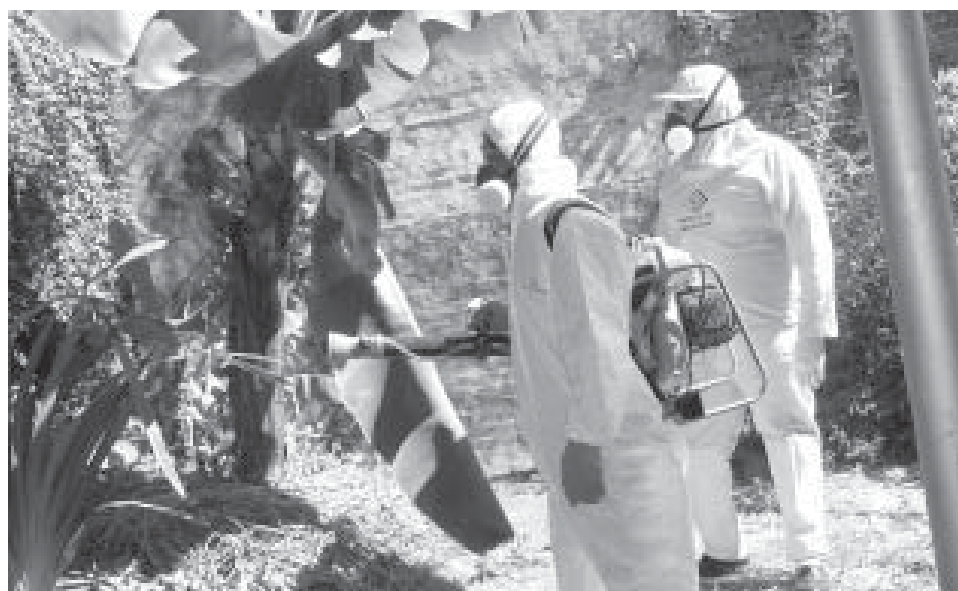
Equipe pulveriza quintais de casas na Vila Santana

A pulverização não invalida a necessidade de retirada de criadouros, que é a forma mais correta e eficaz para o controle da dengue. Até esta terça-feira, Valinhos notificou 70 casos da doença, sendo 56 autóctone (42 na Vila Santana) e 14 importados (contraídos em outros municípios). No ano passado, foram notificados seis casos e todos eles contraídos em outros municípios.