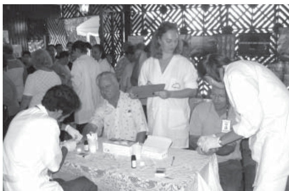
Visitantes fazem exames de Saúde na edição do evento realizada em 2005

A diversão para as crianças também está garantida no "Sabadomania". No Parque Municipal serão preparados espaços para piscinas de bolinha, futebol e vôlei de sabão, balão pupa-pupa, body jump inflável, pirâmide de escalada inflável e mini-quadradas de futebol, vôlei e basquete, mesas de damas, dominó, tênis de mesa e pintura de rosto, camas elásticas e oficina de argila, oferecidos pelo Sesi e pela Secretaria de Esportes e Lazer.