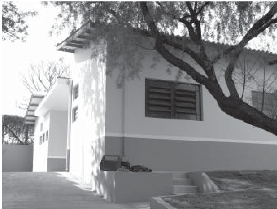
Unidade do Macuco passará a contar com atendimento odontológico

Em breve terá início a reforma e ampliação da Unidade Básica de Saúde do São Bento. A partir do término dessas obras as 13 UBS's do município passarão a contar com dentistas nos seus quadros.