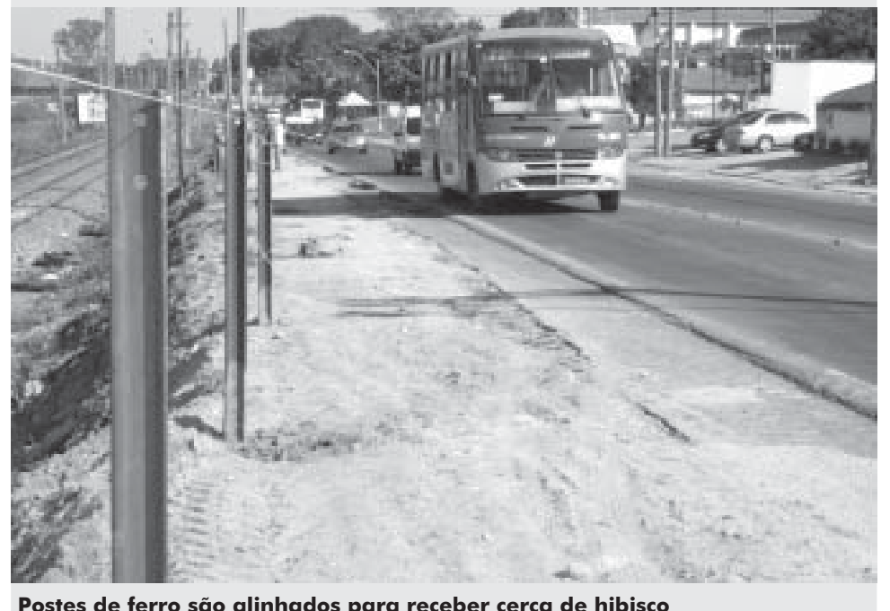
Postes de ferro são alinhados para receber cerca de hibisco

estão sendo realizadas no sentido Vinhedo/Valinhos, ao longo dos 2,5 quilômetros da rodovia para isolar a linha férrea. A implantação desta melhoria faz parte do processo de revitalização das entradas e dos espaços públicos da cidade.