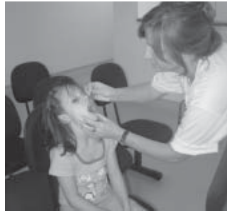
"Gotinha" é para crianças até 5 anos