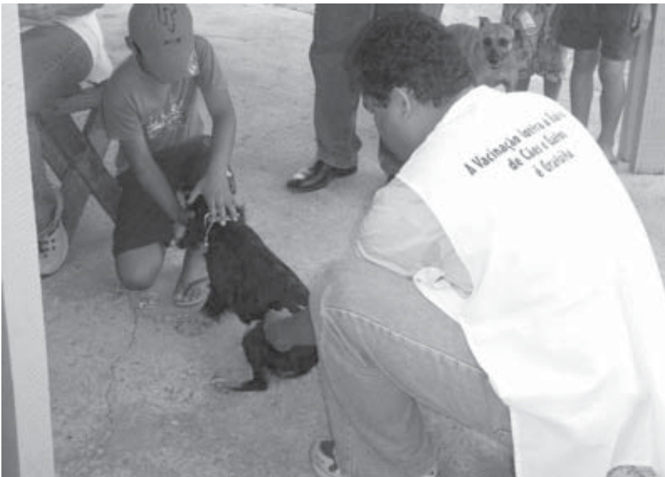
Todos os cães e gatos com idade superior a três meses precisam ser vacinados

A Secretaria de Saúde, por meio do Departamento de Saúde Coletiva, realizará a campanha de vacinação contra raiva em cães e gatos na área urbana de Valinhos neste e no próximo final de semana, dias 15, 16, 22 e 23. Em cada dia da campanha, serão montados postos de vacinação em escolas, postos de saúde, centros comunitários e praças. A estimativa do Departamento é vacinar aproximadamente 24 mil animais.