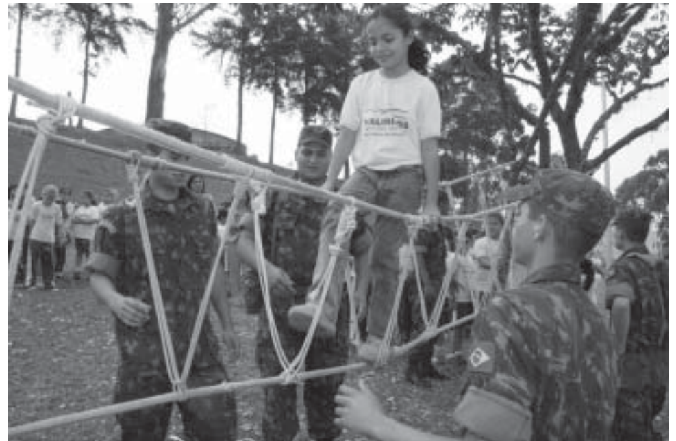
Alunos da EMEF Luiz Antoniazzi visitaram base da tropa no Parque Municipal

De acordo com o chefe de Comunicação Social da 11ª Brigada, Major Alfredo Ferreira Nunes, exercícios como este são de grande importância para o preparo e avaliação da tropa, e a colaboração das diversas autoridades, instituições envolvidas e, principalmente, da população local "é fundamental para o sucesso dessas atividades operacionais e o alto índice de credibilidade que as Forças Armadas desfrutam junto ao segmento civil da sociedade brasileira".