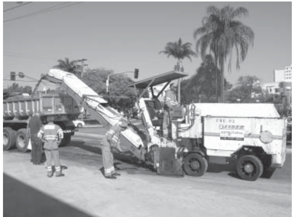
Máquina retira parte de capa asfáltica antiga na Avenida dos Imigrantes

Também receberão o recapeamento: Orosimbo Maia (trecho de onde parou o recape realizado no mês passado até o início da Domingos Tordin), Domingos Tordin (Bom Retiro, pavimentação na totalidade da extensão), Luiz Bissoto (da Domingos Tordin até a escola e até a cancela da Avenida Paulista), Vitória Régia (atrás do CLT - pavimentação em toda a extensão), Manacás (rua da EMEI Vereador Professor Penho Conte, no Novo Mundo I, trecho entre as ruas Vitória Régia e Antônio Tassi) e Antônio Tassi (paralela à Rodovia Flávio de Carvalho, na totalidade).