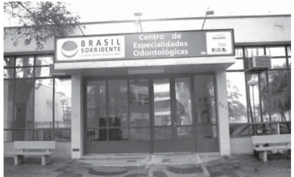
Centro odontológico funcionará na antiga sede do DAEV, ao lado da Prefeitura

Nos postos é oferecido atendimento básico, como restaurações, extrações, limpeza e aplicação de flúor. atendimentos de emergência e extrações são realizados no CAUE (Centro de Atendimento de Urgências e Especialidades). O Departamento de Odontologia também mantém uma equipe, composta por dentista, auxiliar e agente de saúde, para realizar palestras, ensino de escovação, nas escolas duas vezes ao ano. É um trabalho de prevenção que atinge 11 mil alunos da rede pública.