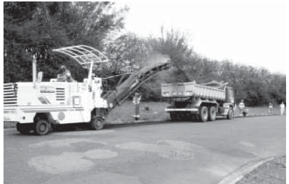
Máquina realiza raspagem da antiga capa asfáltica na Av. Campos Salles

Outras vias da cidade que serão recapeadas são: Avenidas Invernada (da portaria da Unilever até a rua Carlos Penteadou Stevenson), Arq. Clayton Alves Corrêa (via principal do bairro Vale Verde), 11 de Agosto (cobertura do paralelepípedo entre as Avenidas Independência e Paulista) e Rua Itália (cobertura do paralelepípedo da Rua 13 de Maio até a Avenida 11 de Agosto). Também receberão recapeamento: Ruas Domingos Tordin (bairro Monte Verde), Luiz Bissoto (Bom Retiro), Vitória Régia (atrás do Centro de Lazer do Trabalhador "Ayrton Senna da Silva), Manacás e Antonio Tassi (ambas no Jd. Novo Mundo).