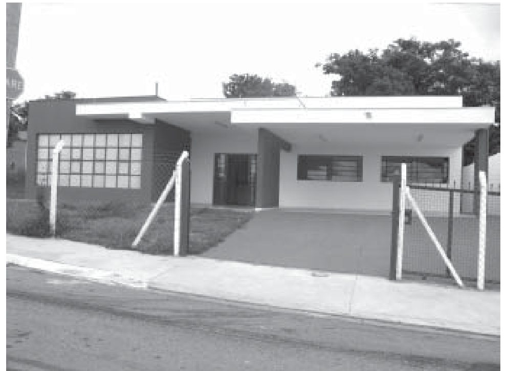
Prédio abrigará posto da Guarda Municipal e de atendimento bancário

O núcleo habitacional Jardim São Marcos, com 903 casas, foi construído pela CDHU em 1992, portanto há 15 anos. De lá para cá, o bairro e a região se transformaram em uma mini-cidade, com uma população de cerca de 15 mil pessoas.