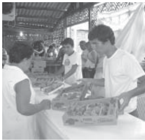
Vendas de frutas é uma das atrações

Segundo a Comissão Organizadora, nesta primeira semana de festa o Parque Municipal "Monsenhor Bruno Nardini" recebeu "milhares de visitantes. A expectativa é de que o evento supere as 470 mil pessoas que compareceram à festa no ano passado, bem como as 195 toneladas de frutas vendidas pelos agricultores da cidade.