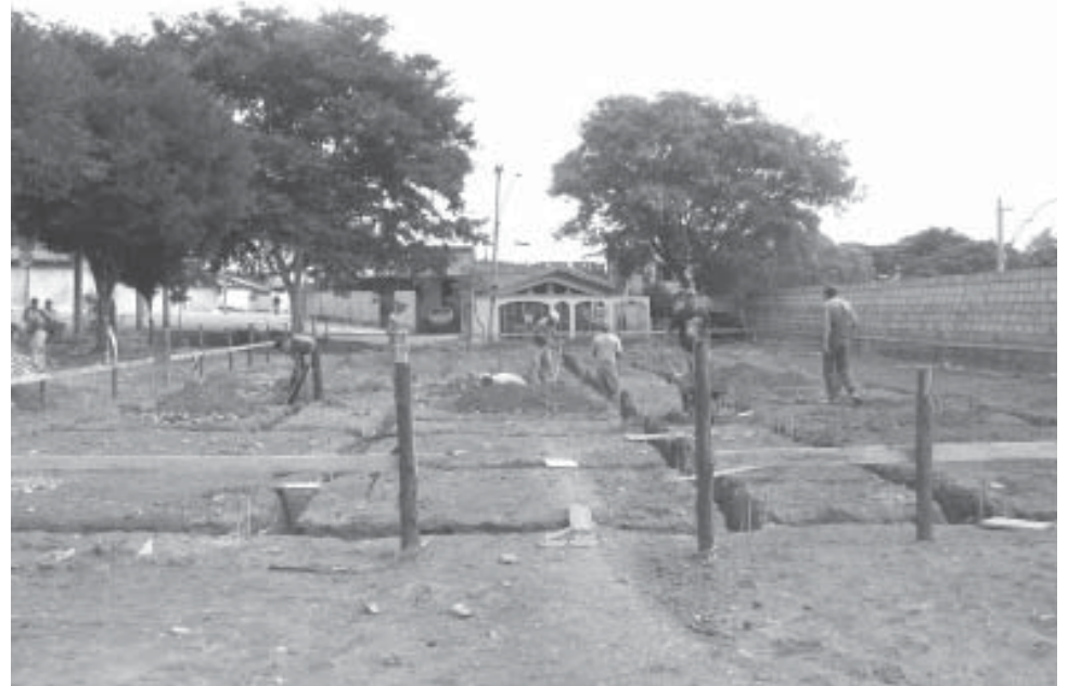
Construção do Pronto-socorro no Jd. São Marcos está em fase de fundação

A unidade será construída na Praça Amélio Borin e abrigará também a Unidade Básica de Saúde que atualmente funciona no bairro Capuava. Em 500 metros quadrados de construção, a unidade terá seis consultórios: três gerais, um odontológico (com capacidade para dois equipamentos), um ginecológico (com banheiro) e um pediátrico. Ainda devem ser construídas dez salas, sendo elas para programas de saúde; curativo e procedimentos; coleta e medicação; inalação; pré-consulta; enfermagem; emergência; observação feminina e infantil (com banheiro), observação masculina (com banheiro) e descanso médico. O projeto ainda contemplará uma área lúdica, sala de recepção, farmácia, dois depósitos de materiais, área coberta para estacionamento de ambulâncias, copa, sala de arquivo e digitação, vestiários, banheiros (para usuários e funcionários), jardins e rampas de acessos.