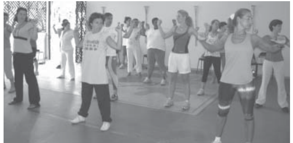
Instrutores participam de aula prática de Lian Gong no Parque Municipal

Os dentistas também darão orientações sobre uso e limpeza de prótese e farão avaliação de restaurações e de extrações necessárias.