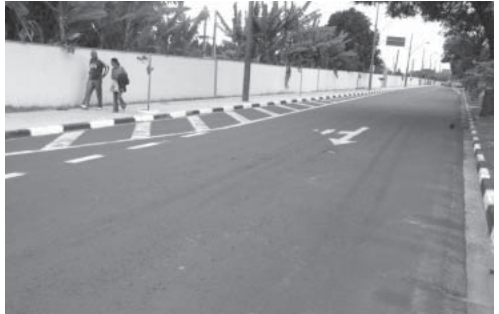
Avenida Paulista será palco de muita diversão e lazer neste domingo

A infra-estrutura do local também contará com segurança (feita pela Guarda Municipal), praça de alimentação e banheiros químicos.