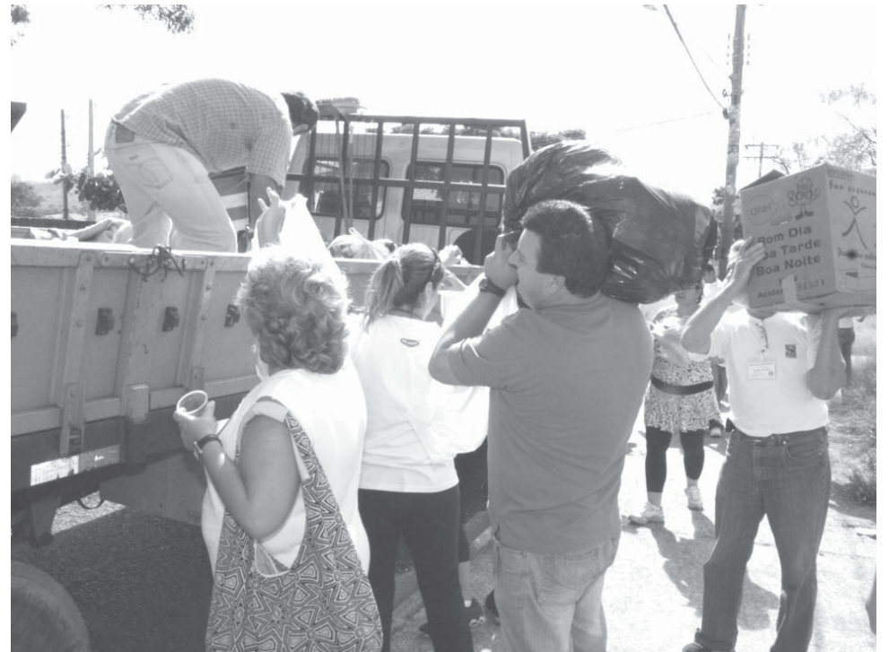
Mutirão arrecada donativos para campanha de inverno do Fundo Social

Os interessados deverão ir à sede do Fundo Social, localizada na Rua José Milani, nº 241 (ao lado do Cartório), no Centro, das 8 às 12 horas e das 13 às 17 horas, munidos de RG e comprovante de residência, uma vez que o benefício só será concedido às famílias carentes residentes na cidade, além de comprovante de renda familiar de até dois salários mínimos. Informações podem ser obtidas pelo telefone 3871-2988.