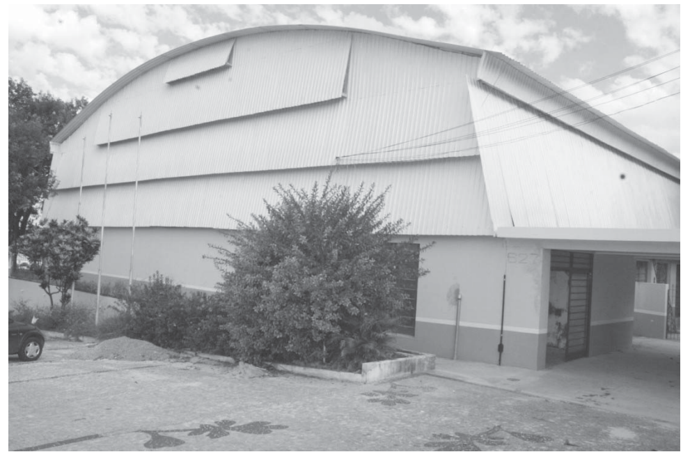
Nova sede oferecerá melhores acomodações para alunos e professores

Nos últimos últimos anos foram criados os cursos de capoeira, percussão, técnica vocal, alongamento, danças brasileiras, brincadeiras infantis, dança de salão, bandolim, violino, entre outros, além de corpos estáveis, como a Orquestra de Violas "Cultura Caiçara", Compasso e Compasso Kids, Teatro da Garagem, e a Orquestra de Câmara, que está em formação e homenageará o grande cantor e compositor valinhense, Adoniran Barbosa.