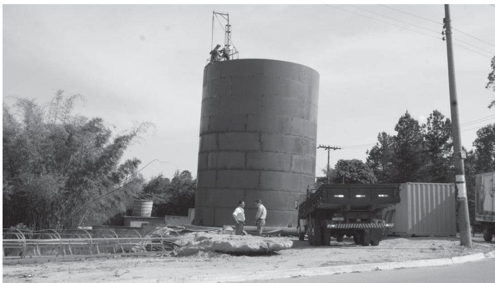
Instalação de chaparia no reservatório é feita manualmente