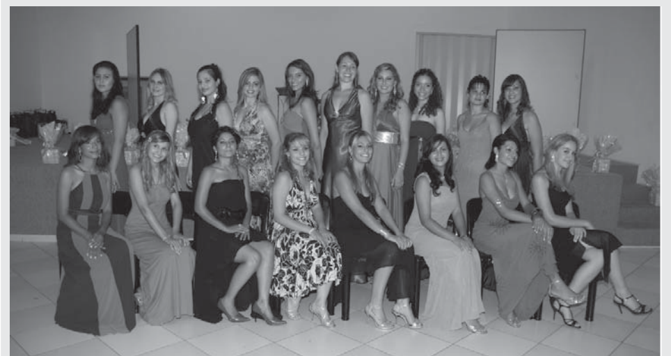
As 18 candidatas foram apresentadas em coquetel no dia 7 de novembro

As pessoas interessadas em obter um financiamento devem procurar a unidade do Banco do Povo Paulista para fazer uma análise de crédito. A unidade atende de segunda a sexta-feira, das 9 às 16 horas, na Rua Antônio Carlos, 474 - Centro (antigo Valinhos Clube). O telefone de contato é o 3871-3411, e-mail bpvalinhos@valinhos.sp.gov.br ou pelo site www.bancodopovo.sp.gov.br .