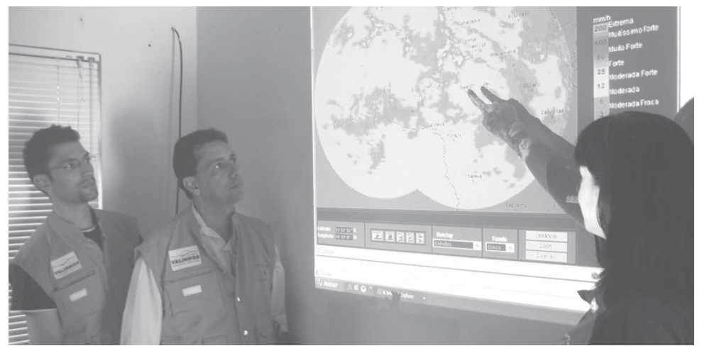
Equipe da Defesa Civil observa mudanças climáticas em imagem de radar

"Com a utilização dos recursos oferecidos pelo monitoramento meteorológico, é possível verificar com precisão o deslocamento da chuva, se vem acompanhada de granizo, além da velocidade do vento. Com isso, podemos observar com antecedência, situações de riscos e adotar medidas preventivas e operacionais", conta a agente.