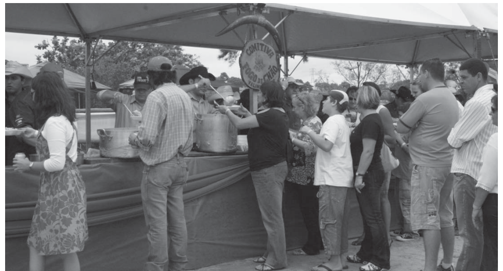
O almoço na Queima do Alho é preparado pela comitiva de tropeiros de Fogo Di Chão