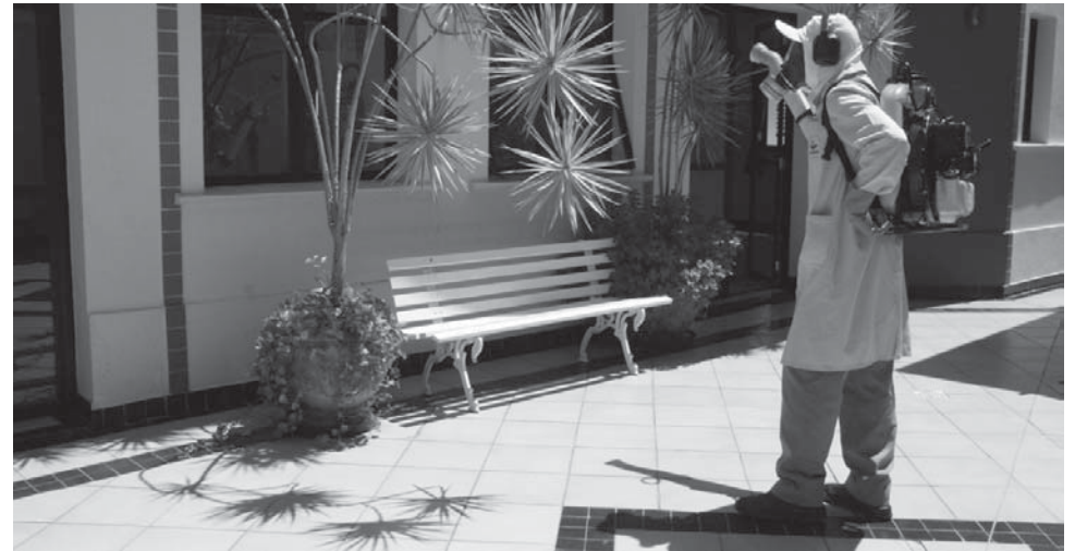
Sucen realiza pulverização de imóveis na área central

A dengue é uma doença causada por um vírus, transmitido pela picada do mosquito Aedes aegypti infectado. Pode causar febre alta, dores musculares e na cabeça e manchas vermelhas pelo corpo. O mosquito tem hábitos diurnos sendo que apenas a fêmea costuma picar. Para sua sobrevivência, é necessário acúmulo de água limpa, encontrados em pratinhos de plantas, caixas de água descobertas, objetos jogados ao relento, entre outros. Daí a importância da eliminação desses criadouros para a prevenção da doença.