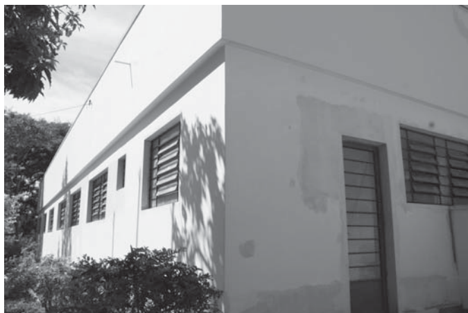
EMEI Boa Esperança passa por reforma geral