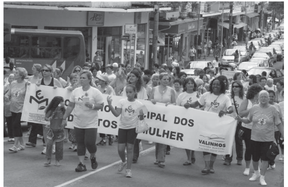
Caminhada da mulher em 2008 reuniu muitas participantes

Os taxistas (permissionários e seus prepostos) devem levar ao local da vistoria uma cópia dos seguintes documentos: Carteira de Habilitação, comprovante de residência e de aferição do taxímetro expedido pelo IPEM (Instituto de Pesos e Medidas do Estado de São Paulo) e documento do veículo.