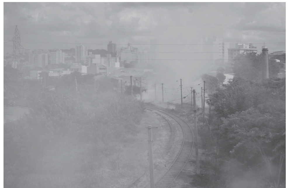
Incêndio registrado sábado às margens do Ribeirão Pinheiros

Outra contribuição virá do PAM (Plano de Auxílio Mútuo), implantado em 2005 pela administração municipal. O PAM tem a participação de empresas, das secretarias municipais, Guarda Municipal, Corpo de Bombeiros, da AutoBAN (concessionária que administra as rodovias Anhanguera e Bandeirantes) e da DERSA (Desenvolvimento Rodoviário S.A.).