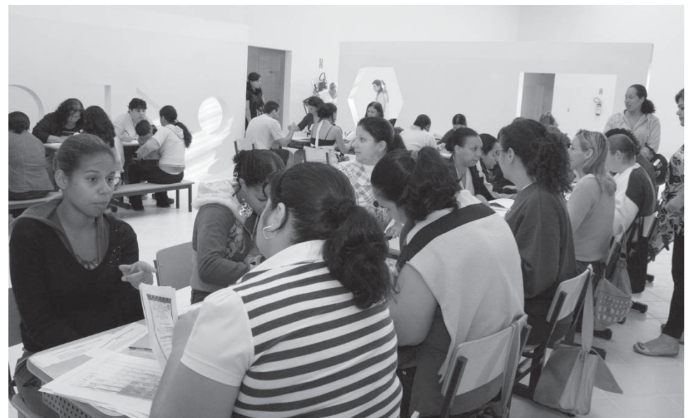
Solicitações de vagas vão até quinta-feira no próprio CEMEI do Jd. Maracanã

Segundo o secretário da Educação, a região do Jardim Maracanã foi escolhida para implantação da creche por apresentar um número grande de crianças que precisam frequentar creche. Ele destaca que a educação infantil, nessa faixa etária, com o papel de cuidar e educar, é fundamental nos dias de hoje em que o casal precisa trabalhar fora e não tem tempo e nem condições de ficar com as crianças em casa. "A administração municipal tem procurado, na medida do possível, suprir esta demanda da população", contou Ruedell.