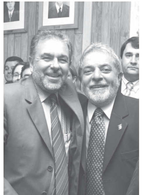
Marcos e Lula na assinatura do PAC