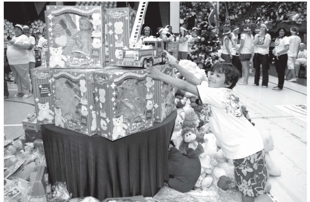
Na festa as crianças escolhem os brinquedos que querem levar para casa