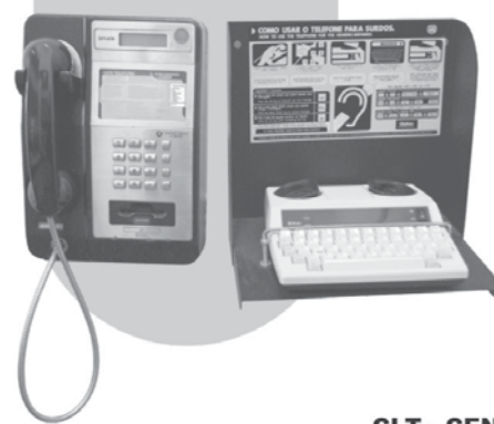
Art 8º, inciso II, da Lei Complementar nº 75/93