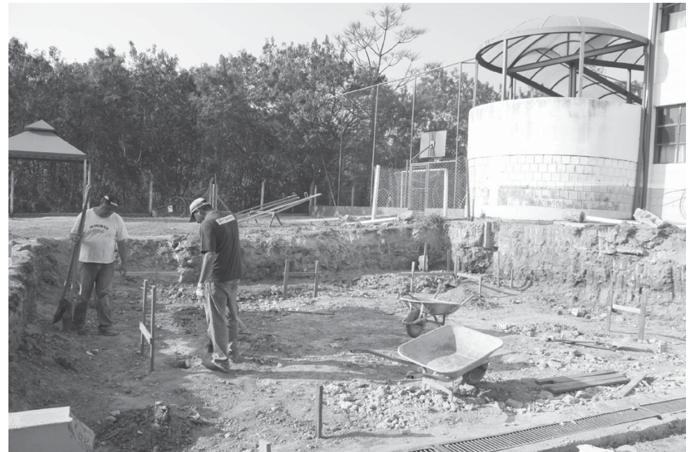
Construção de mais uma sala na EMEB José Vicente Marchiori no Bom Retiro

Finalizando essa sequência de ampliações, está a EMEB Estephania de Carvalho Vieira Braga, do Jardim Pinheiros. Lá serão construídas quatro salas de aula, dois banheiros para funcionários, além da reforma dos sanitários dos alunos. A área a ser construída é de 289,31 metros quadrados. O custo da obra é de mais de R$ 247 mil e a previsão de término é de seis meses.