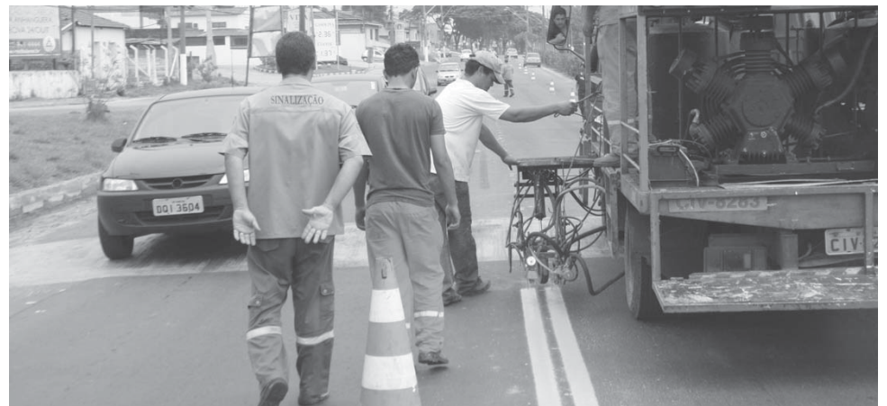
Técnicos efetuam a pintura de solo na Rodovia Valinhos/Vinhedo

Segundo o secretário, uma novidade na implantação desse sistema semafórico é que os equipamentos vão operar com sistema de ondas (GPS), o que dispensa a colocação de cabos de conectores para implementar sistema de sincronização entre os diversos equipamentos semafóricos instalados ao longo da rodovia.