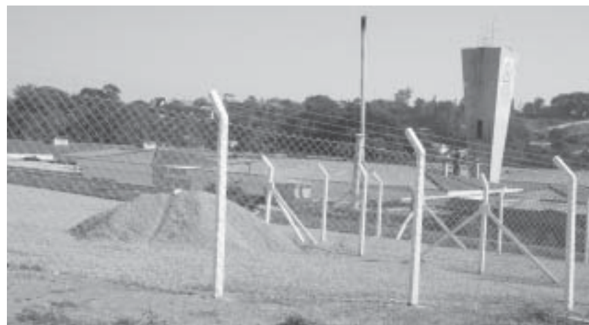
Terreno próximo à Santa Casa onde será construída a unidade da UPA

"Estive reunido com os mesmos técnicos do Ministério que estiveram em Valinhos aprovando a construção no Parque da Festa do Figo e relatei a eles o que estava acontecendo. De pronto eles se debruçaram sobre o projeto anterior, que ainda faltam detalhes para ser concluído, e nos autorizaram a iniciar os procedimentos para uma nova licitação, que irá prever a construção da UPA em terreno da Prefeitura que fica próximo à Santa Casa, que terá 200 m 2 menos que a outra". Após o cancelamento da licitação inicial, já foi autorizada a abertura de outra, que irá prever a construção da UPA no local indicado pelo