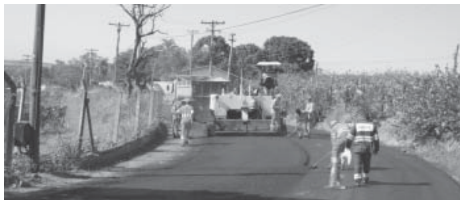
Recape vai atingir 13 km de asfalto entre as duas estradas

A atividade percorre as bibliotecas do Estado de São Paulo entre agosto e novembro, levando uma atração cultural diferente a cada mês.