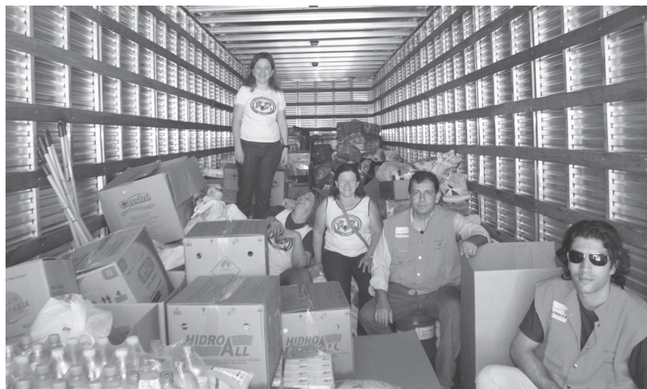
Equipes do Fundo Social e Defesa Civil carregam caminhão com doações

Mais informações pelos telefones 3859-2055 e 199 (ambos da Defesa Civil) ou 3871-2988 (Fundo Social).