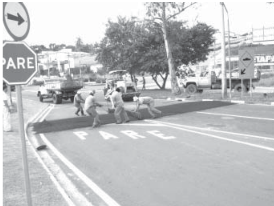
Funcionários da Secretaria de Trânsito trabalham na instalação das lombadas

De acordo com a Secretaria, o projeto de implantação de todos estes redutores e de outros equipamentos de segurança, sinalização vertical e horizontal, contempla a utilização de material adequado e padrões técnicos estabelecidos para rodovias estaduais, com base no Código Brasileiro de Trânsito (Resolução nº 39 do CONTRAN, de 21.05.1998).