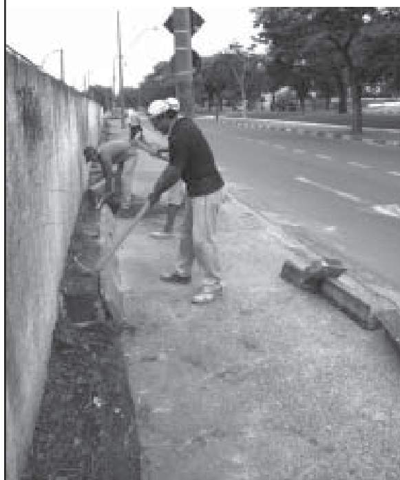
Trabalhadores implantam as melhorias na via

Segundo a Secretaria de Obras Públicas, nas margens do muro será executado o passeio público, em toda a extensão da avenida. Já no trecho que encontra com a Rigesa será construída uma mini praça, com jardins.