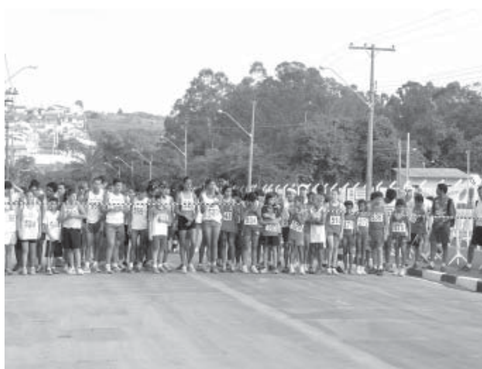
Largada em 2006 da prova estudantil que este ano tem recorde de participação

Central, na Rua Silvío Concon, 78. O motivo da transferência é a reforma do prédio, que passará a abrigar também a nova sede da Casa da Cultura "Vicente Musselli".