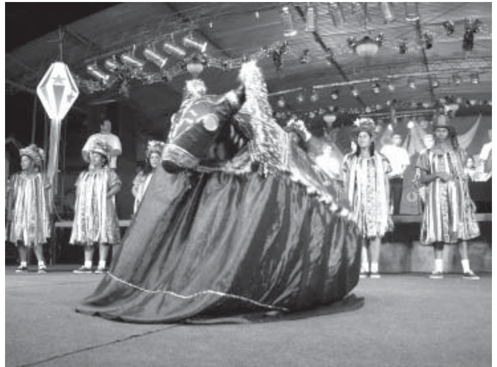
Reisado Sergipano e Bumba Meu Boi do Guarujá serão atrações da festa