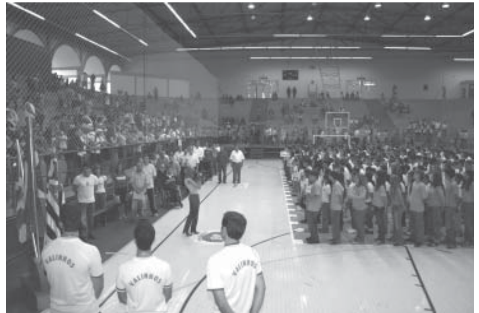
Abertura dos Jogos Escolares reuniu alunos das 20 escolas participantes

Informações através do telefone (19) 3849-3051, de segunda e quarta-feira, das 14 às 21h30, e de terça e quinta-feira das 18h30 às 21h30.