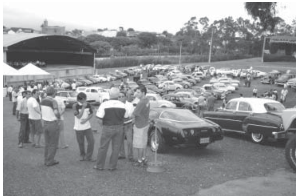
Encontro de carros antigos realizado durante a Festa do Figo e Expogoiaba

A Secretaria de Cultura e Turismo e o Clube de Carros Antigos de Valinhos realizarão neste domingo, dia 17, das 9 às 13 horas, o Encontro de Carros Antigos, no Museu Municipal "Fotógrafo Haroldo Ângelo Pazinato", que estará aberto para os visitantes. Os colecionadores irão expor raridades no evento, que é realizado sempre no terceiro domingo de cada mês. Em janeiro, o encontro foi realizado durante a 59ª Festa do Figo e 14ª Expogoiaba. A participação é livre também para não-associados do Clube, que tenham veículos com mais de 30 anos de fabricação em ótimo estado de conservação.