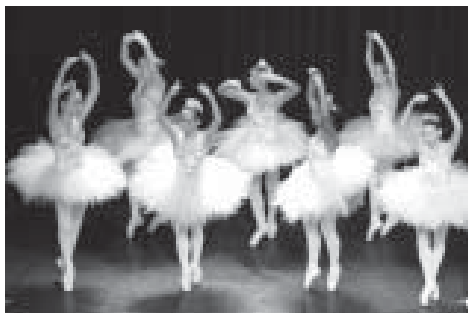
Corpo de Baile em apresentação

O Pré-Corpo e o Corpo de Baile da Casa da Cultura "Vicente Musselli", de Valinhos, realizarão no próximos dias 21 e 23, quinta-feira e sábado, a audição para bailarinos de ambos os sexos