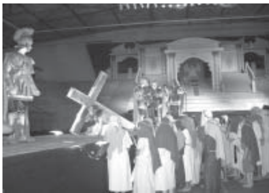
Encenação da Paixão de Cristo em 2007

O espetáculo em Valinhos terá duas apresentações, nos dias 20 e 21 de março, às 21 horas, no Ginásio Municipal de Esportes "Vereador Pedro Ezequiel da Silva", com entrada franca. Informações pelo telefone (19) 3871-3646.