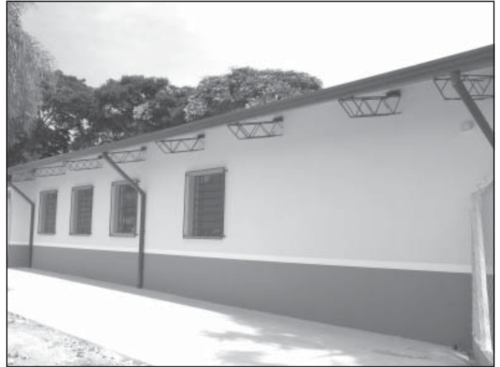
EMEI "Angela Turcatti" passou por reforma completa e ampliação

Atualmente estão em construção o CEMEI do Jardim Maracanã e um novo prédio para abrigar a EMEI e EMEF "Dª Carolina de Oliveira Sigrist" no bairro Capivari.