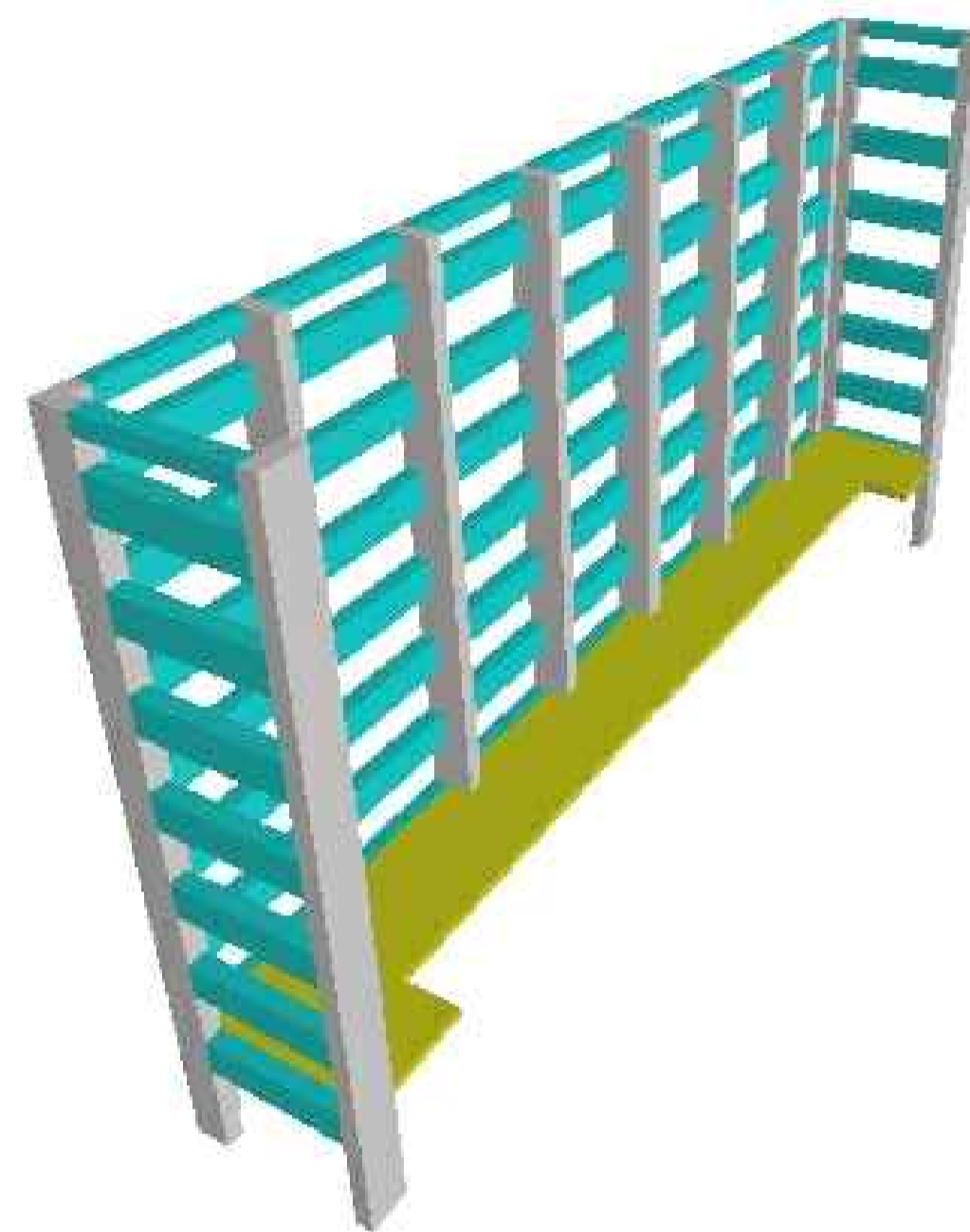
PERSPECTIVA SEM ESCALA